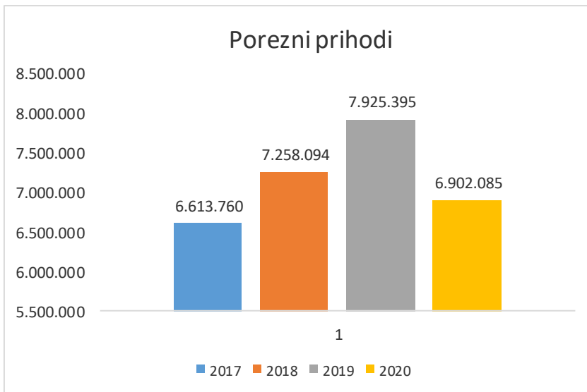
Tabela br. 2 – Porezni prihodi na dan 31.12. u periodu 2017., 2018., 2019. i 2020. godine

U strukturi poreznih prihoda najveći postotak se odnosi na prihod od indirektnih poreza . U ovoj grupi prihoda postoje 3 vrste prihoda i to: