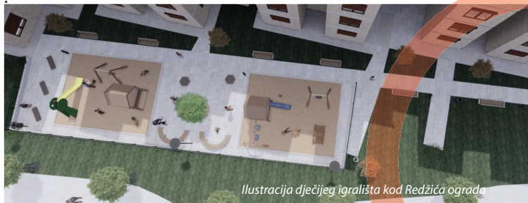
Ilustracija dječijeg igrališta kod Redžića ograda

Općina Velika Kladuša već više od 15 godina iz budžeta izdvaja relativno visok iznos za stipendiranje studenata. Taj iznos svakako ne treba umanjivati, ali promjene na tržištu rada kao i smanjenje broja studenata iziskuju prilagođavanje sistema stipendiranja kako bi ono bilo pravednije i svrsishodnije nego je to sada slučaj. Jako je važno da stipendije budu na raspolaganju studentima veoma brzo nakon početka akademske godine, a ne na njenom kraju – kako je to postalo praksa zadnjih godina. Također, kroz novi sistem stipendiranja i s njim povezane ciljeve, korisno bi bilo uvezati naše studente u inostranstvu s onima u BiH kroz projekte razmjene znanja i iskustava. Cilj nam je da kladuški studenti, u zemlji i van nje, postanu generator naprednih ideja i rješenja i da imaju važnu ulogu u razvoju Velike Kladuše.