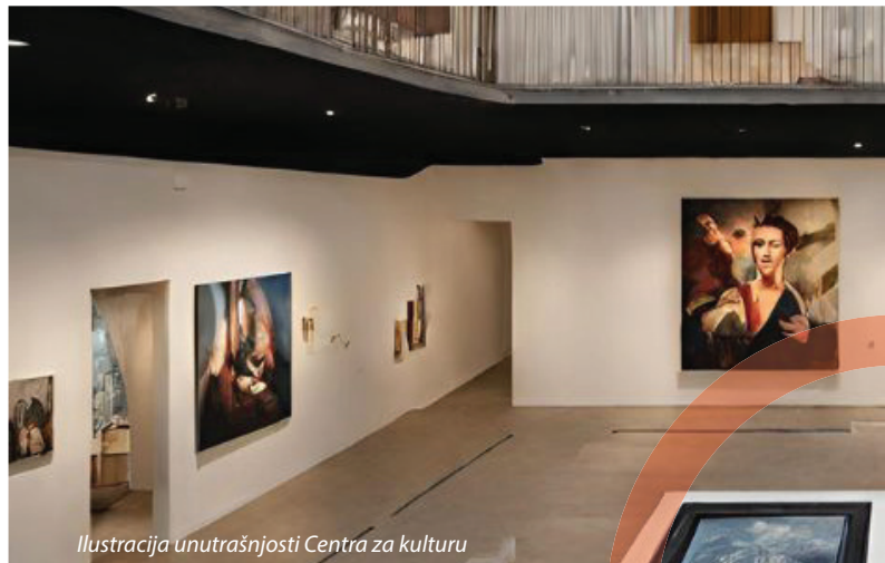
Ilustracija unutrašnjosti Centra za kulturu

Mjesto koje će nuditi raznovrstan kulturni sadržaj, mjesto čiji će prostor koristiti civilna udruženja i neformalne grupe mladih, mjesto u kojem će se moći učiti o našoj historiji i u kojem će se rađati ideje za našu budućnost.