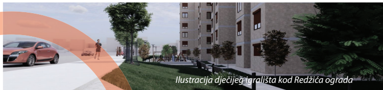
Ilustracija dječijeg igrališta kod Redžića ograda

Predškolskoj i školskoj djeci su potrebna i nova igrališta u njihovim naseljima. Insistirat ćemo da se svake godine predvide sredstva u budžetu za izgradnju najmanje četiri dječija igrališta, ravnomjerno raspoređena u svim dijelovima (mjesnim zajednicama) Velike Kladuše.