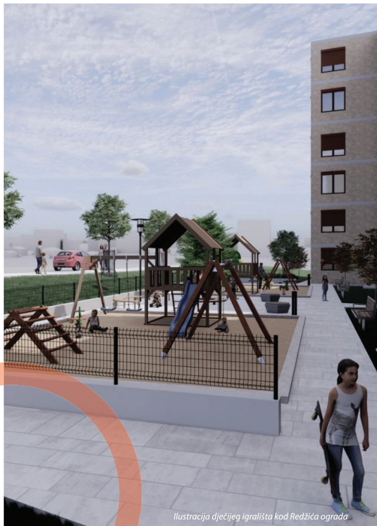
Ilustracija dječijeg igrališta kod Redžića ograda