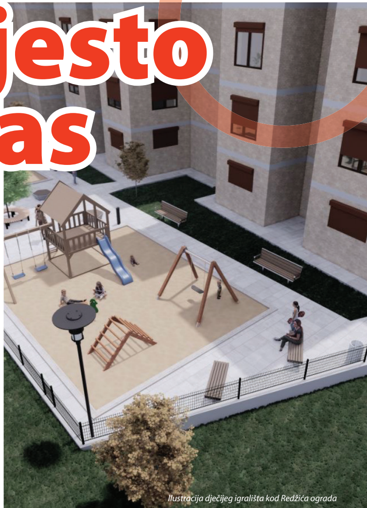
Ilustracija dječijeg igrališta kod Redžića ograda