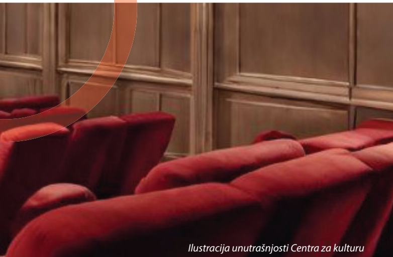
Ilustracija unutrašnjosti Centra za kulturu

Godine iza nas su crne godine za kladaški sport. Kontinuirano smanjenje ulaganja u sport od strane Općine dovelo je do gušenja više sportskih kolektiva, među njima i seniorskog pogona najstarijeg među njima – NK Krajišnik. Budžetska sredstva koja se izdvajaju za sport moraju biti veća i pravednije raspoređena. Pored standardnog granta za Sportski savez, potrebno je uvesti i budžetske grantove namijenjene osnivanju novih klubova, kako bi se proširio broj sportova koje je moguće trenirati u Velikoj Kladaši, kao i radu ženskih sportskih klubova, kako bi se potaknulo masovnije bavljenje sportom među djevojčicama. Ulaganje u sport vidimo kao ulaganje u zdravlje budućih generacija!